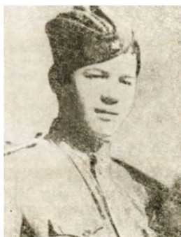
Герой Советского Союза (1944)

Гипотеза: на примере биографии нашего земляка больше узнать о Великой Отечественной войне, о героизме, который он проявил.